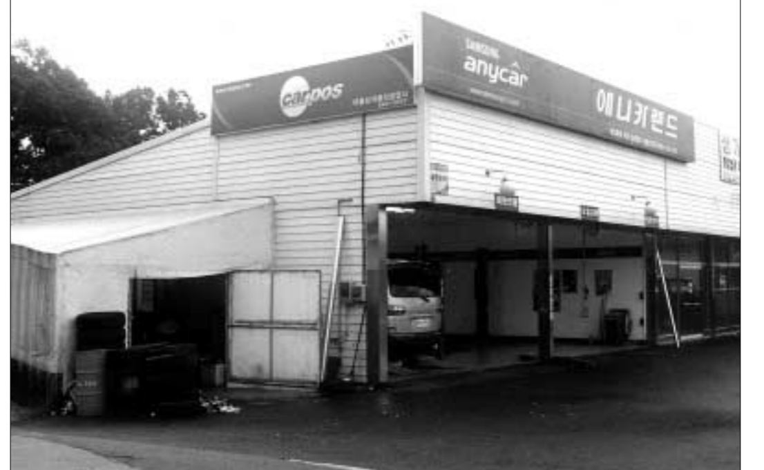
대들보자동차공업사는 고객들의 니즈에 맞는 신속한 대응과 두터운 고객 층을 형성하기 위한 각종 데이터를 총동원해 고객들에게 업소의 존재를 기억시키며 경쟁력을 강화해 나가고 있다.

고객들의 신뢰를 받고 있다. 현재 대들보자동차공업사는 업무 보조를 위한 경리와 10년 이상 경력을 보유한 베테랑 정비사 두 명이 함께 근무하고 있다. 현재 근무하고 있는 세 명의 직원들은 고객들이 불편함이 없도록 쾌적한 공간제공과 친절, 질 높은 서비스와 기술력을 앞세워 고객 유치에 최선을 다하고 있으며 대들보자동차공업사가 지역에서 고객들이 믿고 찾는 제1의 자동차공업사로 거듭날 수 있도록 최선의 노력을 아끼지 않고 있다. 문의전화) 031)542-6527 HP 017)251-5811 정병갑 기자 jpk61@paran.com