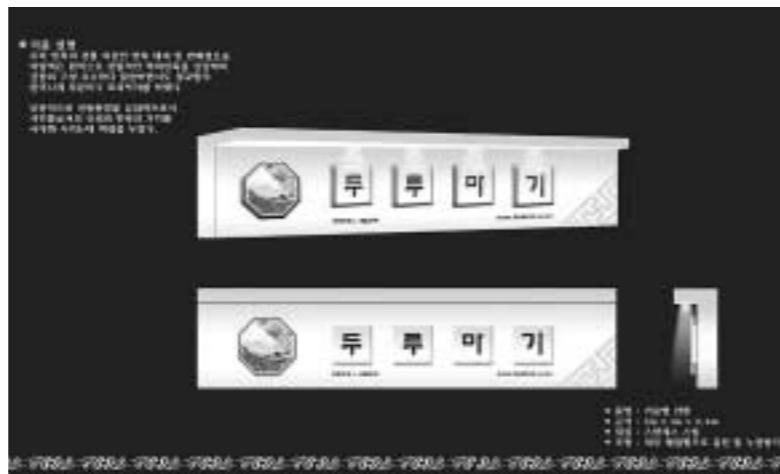
2006 대한민국 아름다운 간판디자인 공모전에서 전문-창작 부문에 출품하여 최우수상을 수상한 작품 (작품명: 두부미기 한복전문점, 출품자: 진영선 영디자인)