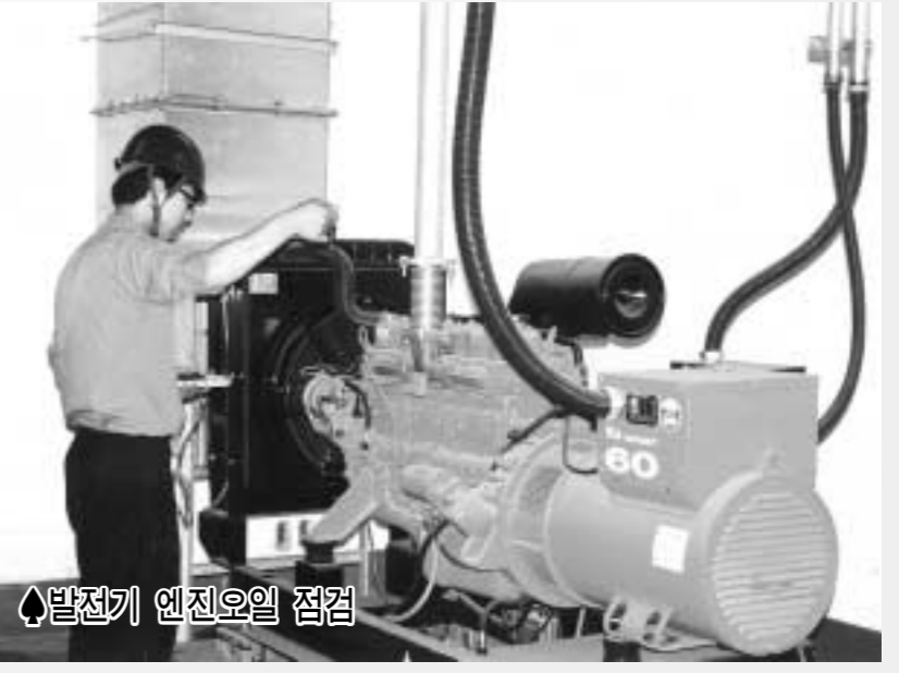
◆발전기 엔진오일 점검