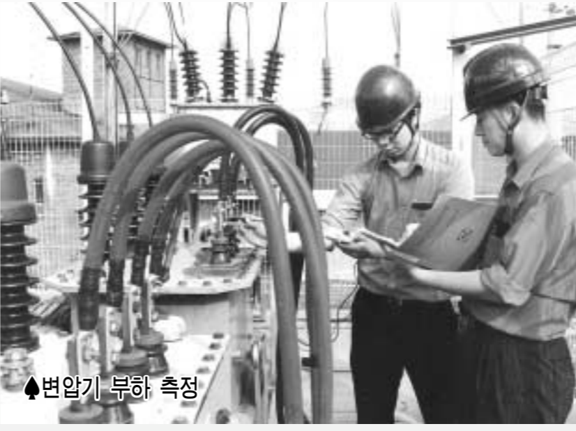
◆변압기 부하 측정

REAL TV - 『TV 속 세상』 2007년 5월 22일(화) 방영업체