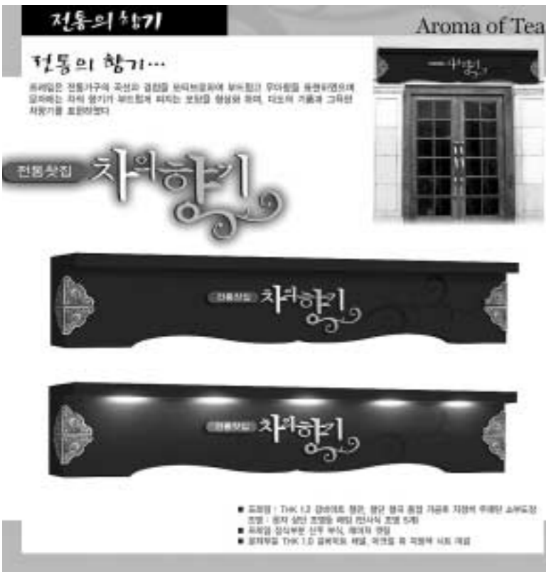
2006 대한민국 아름다운 간판디자인 공모전에서 전문-창작 부문에 출품하여 대상을 수상한 작품 (작품명: 전통의 향기, 출품자 박현숙 간판&디자인연구소)