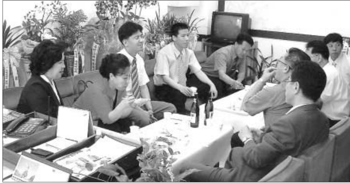
포천시학원연합회 임원들이 간담회를 갖고 포천시 청소년들의 수준을 높이기 위한 교육방법 등에 대해 논의하고 있다.

원인이 각종 불법과외임을 널리 알리고 시민경제의 활성화를 위해 연합회 회원들의 힘을 모아 불법·고액 과외 추방의 당위성을 설명하는 등 공감대 형성을 위해 노력하고 있다.