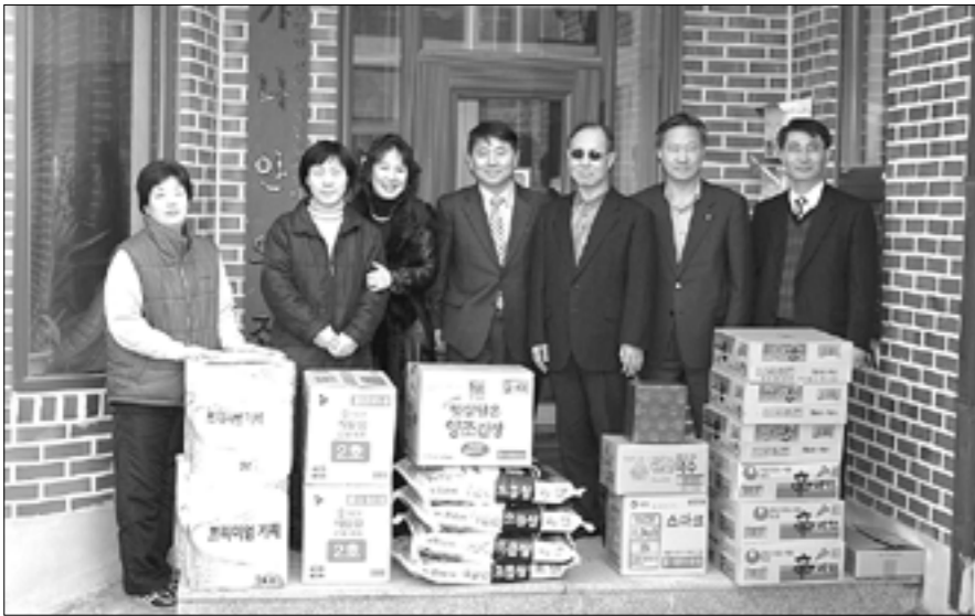
사회복지시설 가나인의 집을 방문해 물품을 전달하고 격려했다.