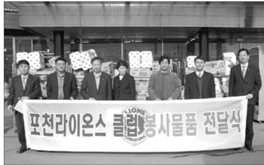
관내 사회복지시설에 물품봉사를 위해 개성인삼조항 마트에서 물건을 구입했다.