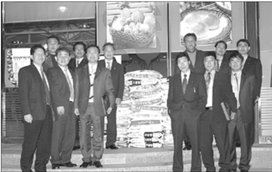
포천라이온스클럽 2006년 송년의 밤에 회원1인당 쌀 20kg 1포대씩 기증받아 관내 사회복지시설에 전달했다.