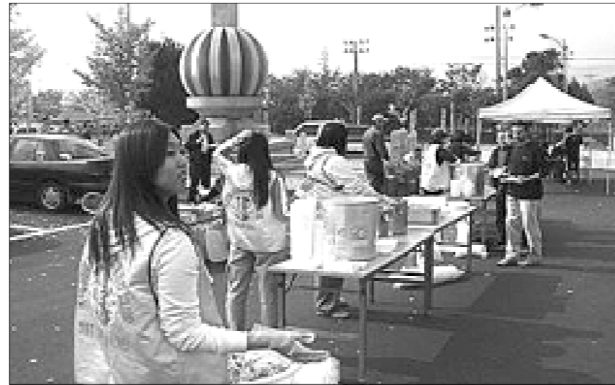
경북레오클럽 회원들은 작년 10월24일 포천종합운동장에서 개최된 외국인근로자 체육대회에 보조도우미로 활동했다.