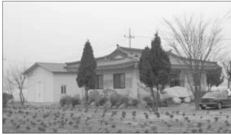
관계자 여러분께 깊은 감사를 드려 가지 어려운 일들에 지원을 아끼지 않았던 포천군수를 위시한

한편, 포천메나리전수회관 건립 취지문에는 “포천메나리전수회관 건립에 물심양면으로 지원을 아끼지 않으셨던 포천의 문화를 사랑하는 많은 분들께 깊은 감사를 드리며 그중에서도 전수회관 건