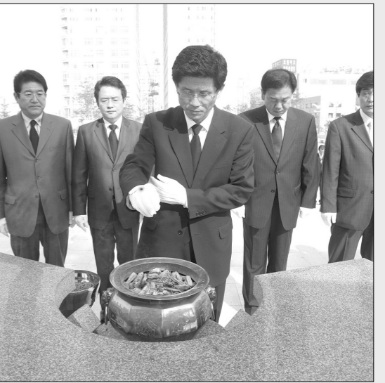
김문수 경기도지사 당선자가 현충일을 참배했다.