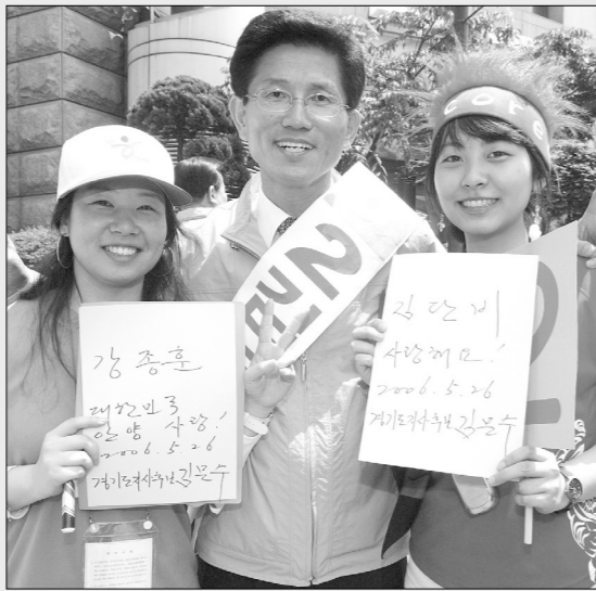
김문수 경기도지사 당선자가 선거유세 기간동안 젊은이들과 함께 김문수 경기도지사 당선자가 가족과 함께 투표를 하였다.