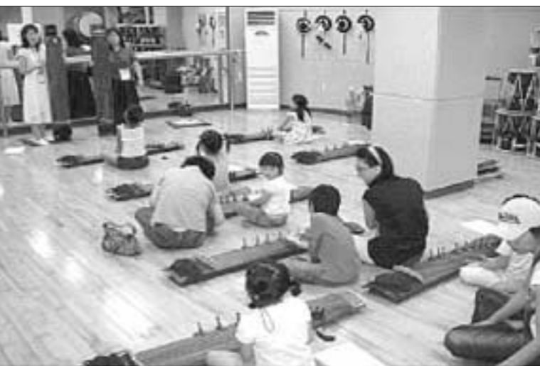
포천시는 겨울 방학을 맞은 초·중·고등학생을 대상으로 우리 전통 예술을 직접 체험해 볼 수 있는 '2008 겨울 청소년 전통예술 체험학교'를 오는 1월 11일 포천반월아트홀에서 개최한다.