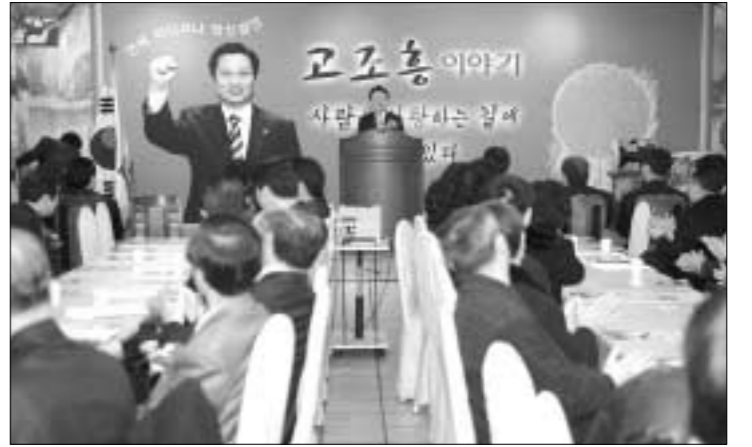
고조흥 국회의원은 1월9일 '고조흥 이야기 - 사람은 사랑하는 길에 내가 있다'는 출판기념회를 겸한 의정보고회를 가졌다.

고조흥 국회의원이 발간한 '사람은 사랑하는 길에 내가 있다'는 어린적 아버지에 대한 회