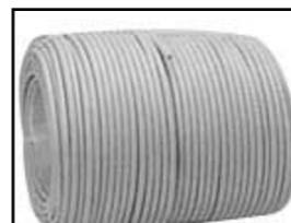
파이프, 덕트, 공조기용 보온재