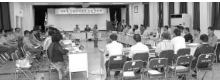
포천소방서는 포천소방서 회의실에서 여름철 소방안전대책 및 소방행정 발전을 위한 간담회를 실시했다.