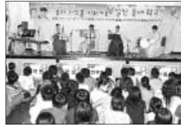
포천교육청은 토요일입일 및 방학 기간을 이용 하여 알찬 틈새 학교를 계획·운영하고 있다.

다양한 학습 방법 및 체험 학습 내용 을 바탕으로 자율성을 키우고 창의 성과 개성을 증대시켜 21세기 교육의 주체로 재탄생 할 것으로 기대된다.