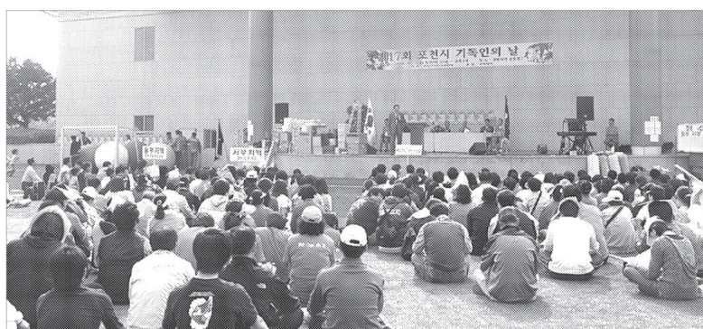
포천시기독교연합회는 10월3일 오전 9시30분부터 경북대학 운동장에서 800여명이 참석한 가운데 제17회 포천시 기독교인의 날 행사를 개최했다.

포천시기독교연합회(회장 박춘식 목사)는 10월3일 오전 9시30분부터 경북대학 운동장에서 800여명이 참석한 가운데 제17회 포천시 기독교인의 날 행사를 개최했다.