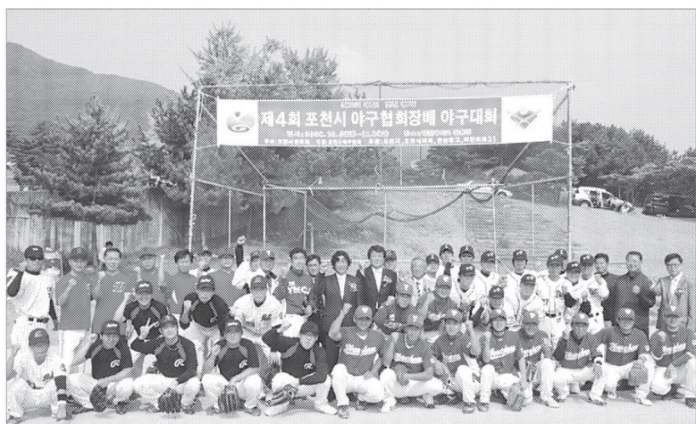
제4회 포천시야구협회장배 야구대회에 참가한 선수 및 내빈 여러분들이 피아팅을 외치고 있다.