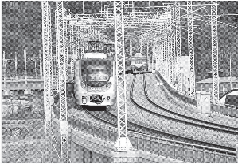
한국철도시설공단에서 실시한 경원선 양주역과 덕정역 사이 구간에 대한 역사 신설 타당성조사 연구용역은 최종보고회를 거쳐 지난 9월17일 용역이 완료되었다.

이 거리는 국토해양부 신설역사 설치 기준인 1.5km에 미달해 역간 거리가 다소 부족한 부분이 있으나, 이날 최종 보고회 자리에서 B/C(비용편익분석), R/C(수익성지수) 등 관련지표는 물론, 기술적 검토와 장애 이용수요 예측, 경제성, 민감도, 재무성을 분석한 결과 회정 산북역사를 신설하는데 타당성이 있는 것으로 보고됐다. 신설 역사의 형태는 산북역의