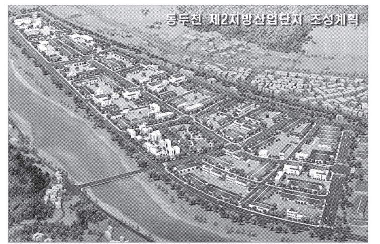
동두천시 낙후된 지역경제를 활성화하고 지방산업의 육성을 통한 고용창출과 지역경제 활성화를 위해 2004년 10월 경기도시공사와 공동사업 사업을 추진하고 있는 동두천2 일반산업단지 분양할 예정이다.

동두천2 일반산업단지는 국도3호선과 연결되고 광역전철(1호선) 철도변에 위치한 역세권(동두천역 도보 10분) 산업단지