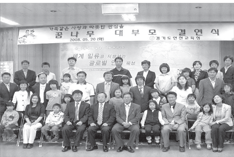
경기도연천교육청은 6월26일 연천초등학교 급식실에서 꿈나무와 대부모가 함께 모여 자장면 먹는 날을 운영했다.

손가정 아이들에게 소중한 가족의 정을 느낄 수 있도록 해주는 것에 대하여 감사를 표하고 학부모들도 앞장서서 적극적으로 돕겠다는 뜻을 전했다.