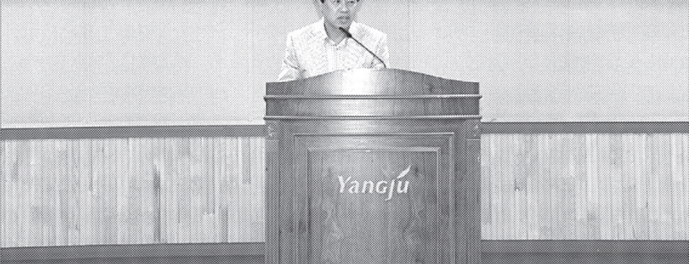
양주시는 예산의 실질적 수요자인 시민들의 폭넓은 의견수렴을 통해 시 살림살이가 더욱 알뜰하게 짜여지고 재정운영의 민주성과 투명성을 높여 나가기 위해 6월26일 시청 대회의실에서 양주시 예산참여시민위원회 주관으로 주제발표회 개최 및 주요투자사업장 방문했다.

들이 스스로 지역사회의 문제를 조사하고 해결하는 과정에 직접 참여함으로써 시민들에게 자치의식을 일깨우는 소중한 기회가 되었다.