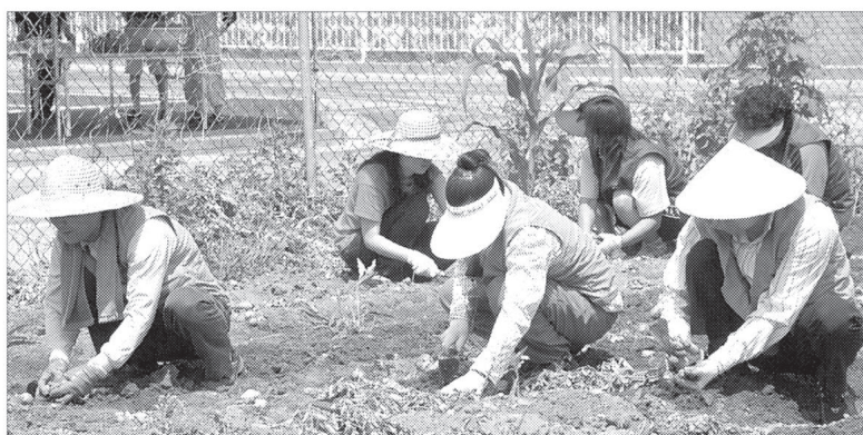
동두천시 송내동 새마을지도자 및 부녀회는 2일 주민센터 부지에 심었던 감자를 수확했다.