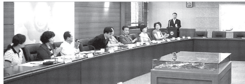
포천시는 6월20일 시청 국제회의실에서 2008 북한이탈주민지원 지역협의회를 개최해 새터민과 함께 하기 위한 효율적인 시책방안을 모색했다.