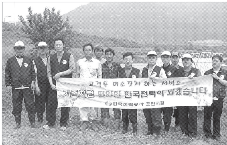
한전 포천지점은 '세상에 빛을 이룩해 사람들'이라는 슬로건 하에 사회적으로 소외된 분들을 찾아 전 직원이 참여하는 사회봉사활동을 적극적으로 실천하고 있다.