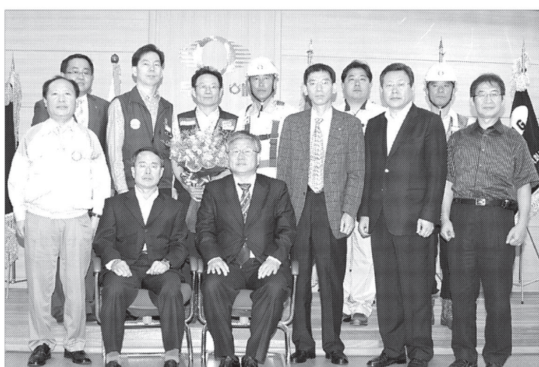
한국산업안전공단 경기북부지도원은 6월26일 지도원 교육장에서 명예산업안전감독관들과 관계자가 참석한 가운데 명예산업안전감독관 수범사례 발표대회를 가졌다.