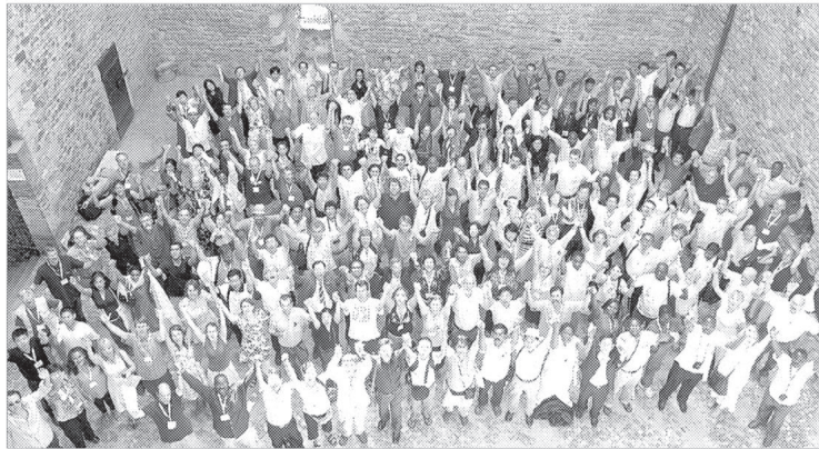
경기도가 세계 유기농업인들의 올림픽인 제17차 세계유기농대회(IFOAM OWC) 유치를 성공했다.

경기도가 세계 유기농업인들의 올림픽인 제17차 세계유기농대회(IFOAM OWC) 유치를 성공했다. 2011년에 개최될 대회는 아시아에서는 처음이며 한국 유기농업의 발전가능성을 인정받았다는 데 의의가 있다.