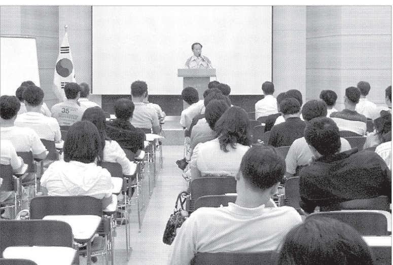
한국산업안전공단 경기북부지도원은 6월24일부터 25일까지 양일간 50인 미만의 영세 소규모 사업장의 안전보건시설 및 작업환경개선에 필요한 자금을 지원하는 클린사업장 조성사업에 참여한 사업주를 대상으로 안전보건 교육을 실시했다.